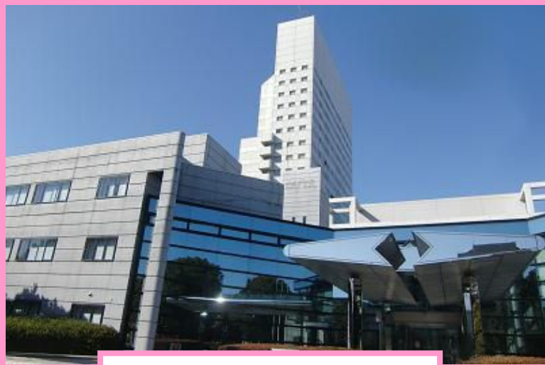
幕張国際研修センター